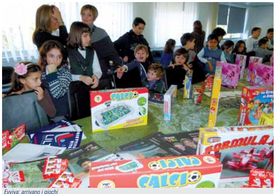
Evviva: arrivano i giochi