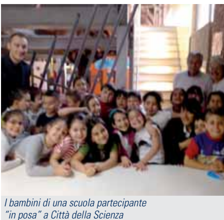
I bambini di una scuola partecipante "in posa" a Città della Scienza