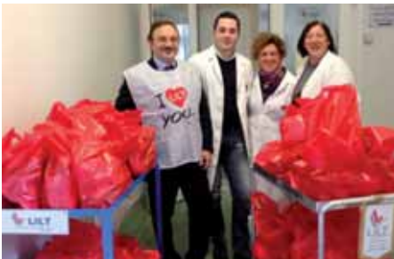
20/12/2012 Festa degli auguri "partono i carrelli" targati LILT con tanti doni per i degenti dell'Istituto Pascale"