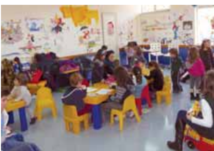
I piccoli giocano e socializzano