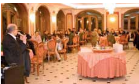
Alcune immagini della presentazione del Nastro Rosa e della serata di beneficenza organizzata dalla delegazione di Caivano.