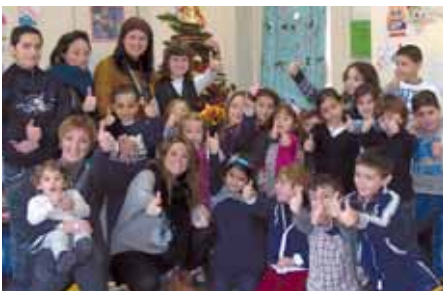
Foto di gruppo: i bambini con gli angeli custodi